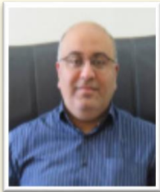
دکتر کمال غانمی گروه شیعی دریای